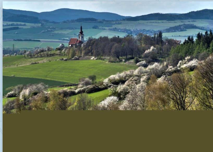
Kostel v Týnci

V Lubech přejedeme hlavní silnici, za mostem odbočíme doleva na cyklostezku, která prochází celými Klatovami. V Klatovech vyjedem z parku u hlavní silnice nedaleko obchodního domu Kaufland. Dáme se po ní vpravo a vzápětí vlevo napříč parkovištěm až na cyklotrasu č. 38. Ta v podstatě prochází celými Klatovami. Je třeba držet se značení, ale dá se říci, že neustále sleduje tok Drnového potoka, a to střídavě z obou stran.