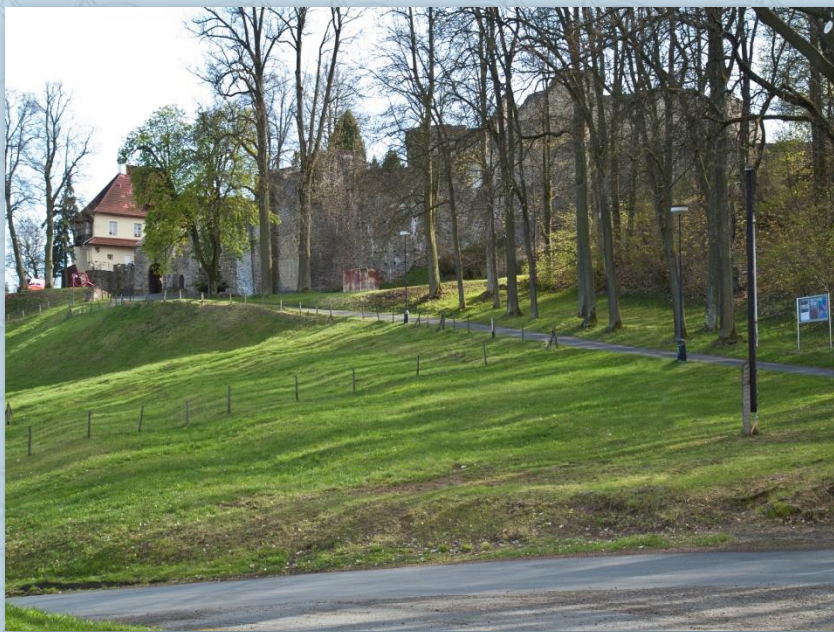
Cesta k hradu Klenová

Po ní přijedeme na kruhový objezd u plaveckého bazénu. Pokračujeme za ním rovně, tedy protilehlým výjezdem. Na dalším kruhovém objezdu, před obcí Tajanov se dáme vlevo a následně najedeme na cyklostezku podél silnice. Ta nás dovede k dalšímu kruhovému objezdu. Dáme se vlevo, do obce Kal (cyklotrasa č. 2052). Za Kalem přejedeme hlavní silnici, projedeme okolo zatopených lomů, které vznikly po těžbě písku. V létě jsou tyto lomy hojně využívány ke koupání. Přijedeme na křižovatku do Bezděkova.